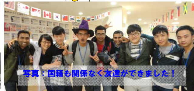
写真：国籍も関係なく友達ができました！