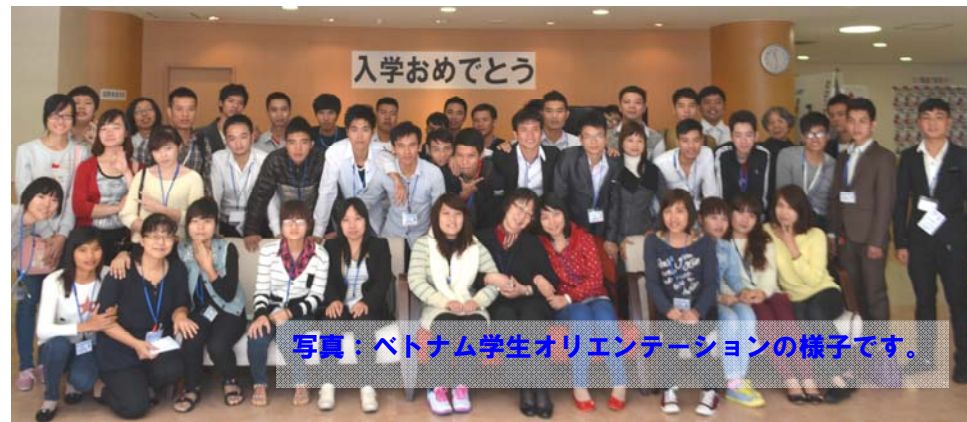
写真：ベトナム学生オリエンテーションの様子です。