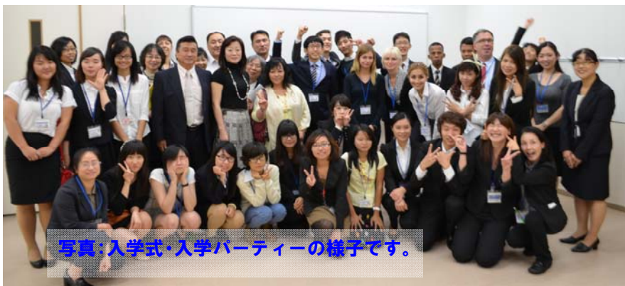
写真：入学式・入学パーティーの様子です。